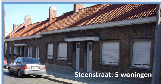
Steenstraat: 5 woningen

Deze 5 woningen stonden in de Steenstraat (wijk 't Ooste)